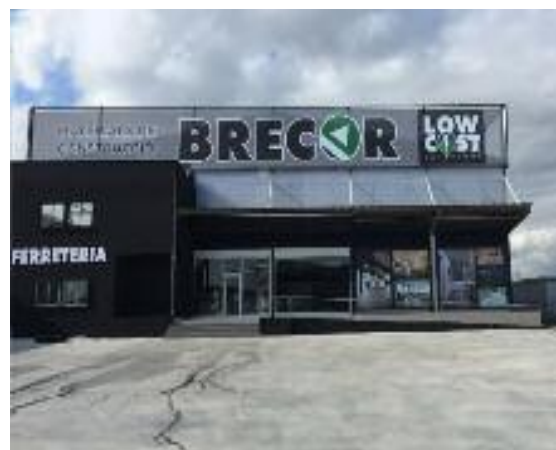
Imatge de l'exterior de la nau situada a la ctra de Santa Coloma nº 2 entrant a Girona, de Vilablareix.

Mantenen un ampli horari d'obertura i atenció al client; de dilluns a divendres 07:30 a 13:00 i 14:00 a 19:00 hores, els dissabtes obert de 09:00 a 13:30 hores. La excel·lent ubicació permet que els accessos siguin rapits i molt fàcils des de qualsevol part de Girona.