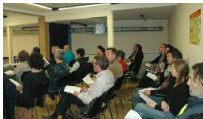
Alguns dels assistents a la sessió celebrada a Figueres.

ment l'inici de l'obra a la Generalitat de Catalunya, tal i com marca la llei que cal fer, i en canvi no es visiti per igual les que han al·ludit aquest tràmit.