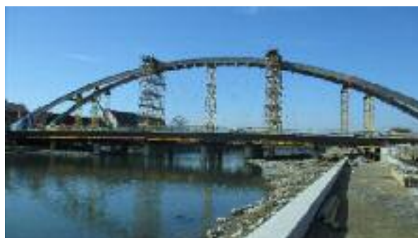
Construcció d'un pont sobre el riu Soła a Polònia.

Al continent americà, RUBAU ha començat a obrir mercat a Bolívia, on s'ha adjudicat la Torre del Poeta, una de les obres d'edificació més importants del país, i ha consolidat la seva presència a Mèxic i Colòmbia amb l'adjudicació de diversos projectes d'obra civil i d'edificació.