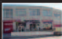
Cabrera de Mar