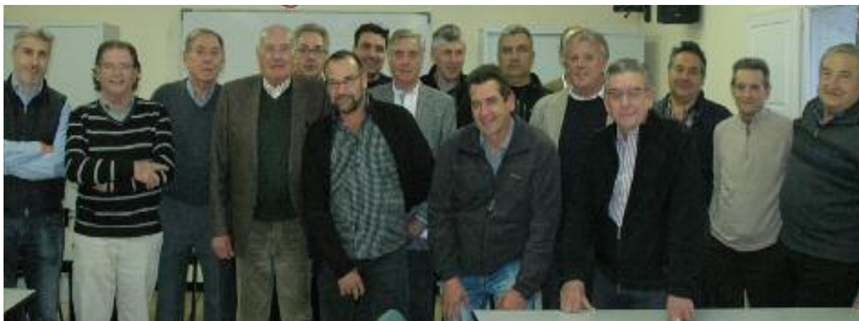
Alguns membres de la Junta Directiva Intercomarcal de la UEC en acabar l'acte de les eleccions.

Amb la constitució dels Òrgans de Govern les empreses de les 7 comarques gironines i tots els oficis, estan ben representades dins de la UEC.