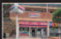
Lloret de Mar