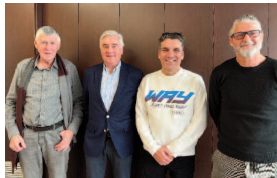
Fotografia dels membres del Comitè Executiu que van signar la constitució de la Fundació.

A partir d'ara es podran organitzar els projectes que s'aprovin sota un patronat que en donarà el vistiplau i en farà el seguiment.