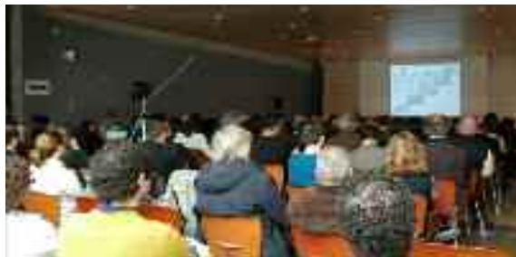
El Col·legi d'Arquitectes de Girona va organitzar un debat sobre les dues moratòries. Foto de l'acte.

Els recordem que amb posterioritat es va dictar una segona moratòria (suspensió temporal de llicències) que afecta la zona entre els 500 m i 1000 m de la línia de la costa. Per aquest segon espai no disposem d'informació suficient del que succeirà al respecte.