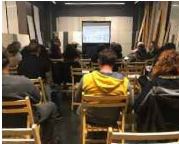
imatge de l'espai dins les instal·lacions de l'empresa Brecor a Blanes a on es va celebrar la trobada.

Un dels temes més innovadors és el de la moratòria a la Costa Brava, del qual també es va informar.