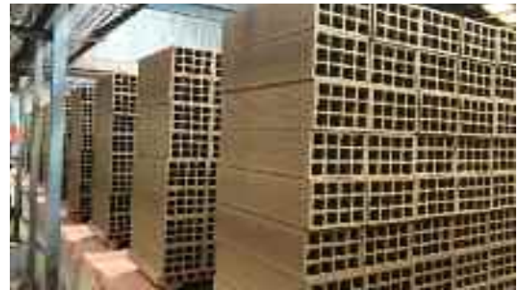
Peces de bloc ceràmic estructural abans d'entrar al forn. El seu color és més fosc i marró.

La introducció de construir amb aquesta peça en la nostra societat ha estat lenta, però imparabile, és una realitat, i els contractistes que ho proven, repeteixen. Actualment són més de 100 les obres executades a la província de Girona amb aquest sistema.